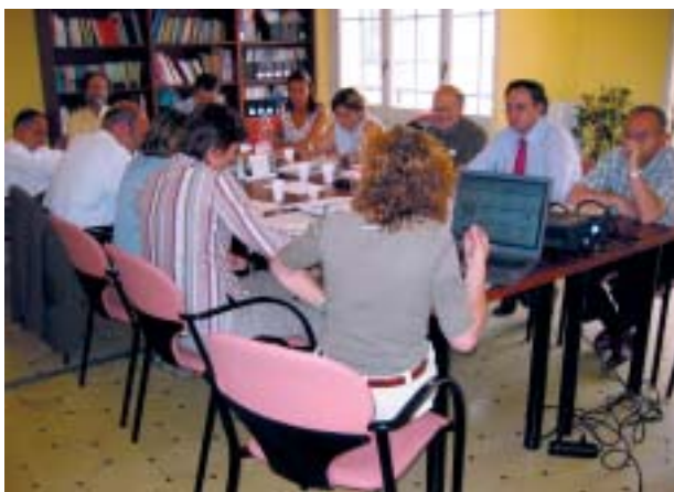
Sessió de treball de les persones expertes.

Una vegada finalitzat el programa pilot, l'any 2007, l'Agrupació de Desenvolupament RSE.COOP té previst transferir aquesta eina i lliurar-la gratuïtament a totes les organitzacions interessades en la seva implantació.