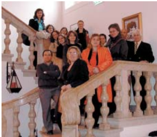
Reunió a Portugal de les entitats associades al projecte transnacional.